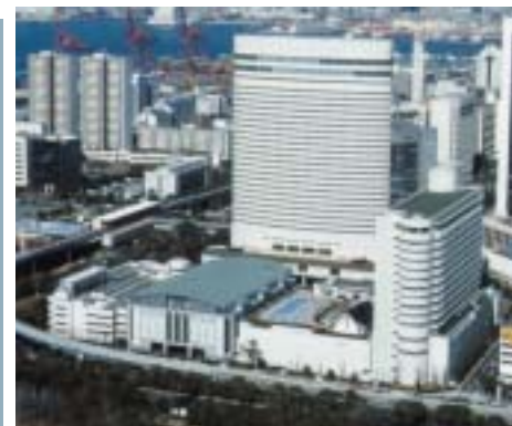
神戸ポートピアホテル&ホール Kobe Portopia Hotel and Hall