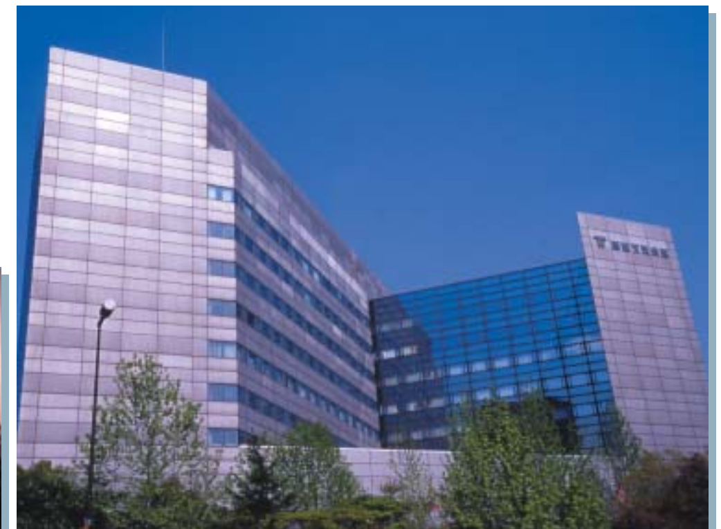
神戸国際会議場 International Conference Center Kobe