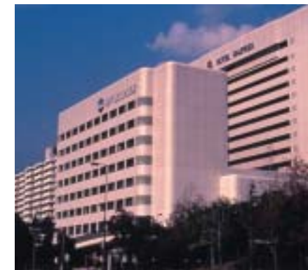
神戸商工会議所会館 Kobe Chamber of Commerce Industry Hall