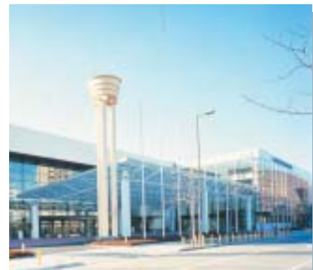
神戸国際展示場 Kobe International Exhibition Hall