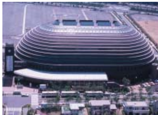
ワールド記念ホール World Hall